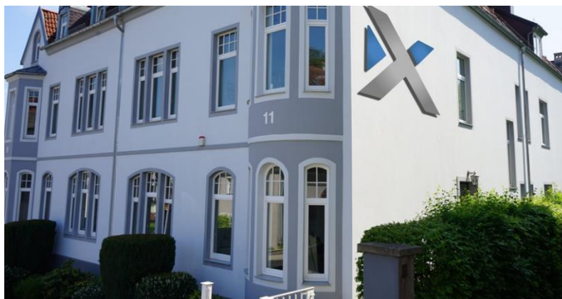
Bild: Schulungsgebäude in Bielefeld. Schulungen finden bevorzugt online oder auch vor Ort in Berlin oder in Bielefeld statt.